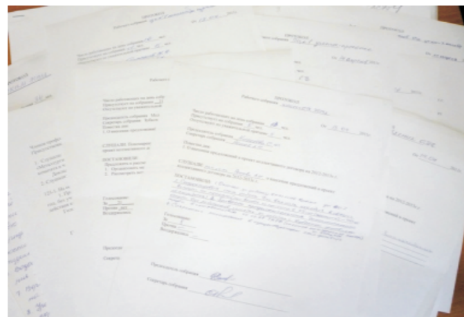
Протоколы рабочих собраний по сбору предложений из подразделений предприятия