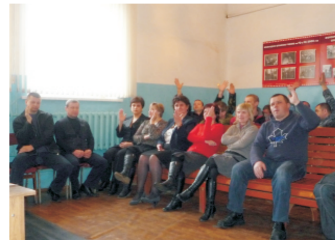
Отчетно-выборное собрание в пожарной охране

В ходе отчетно-выборных собраний в подразделениях и профгруппах проводится награждение лучших профактивистов: профгруппоргов, членов цехкома, уполномоченных по охране труда.