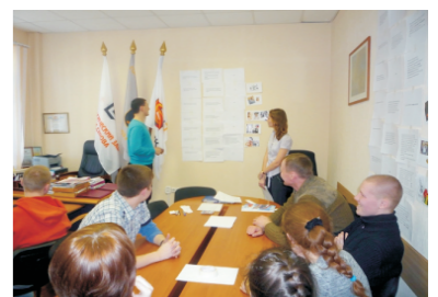
Презентация работы группы