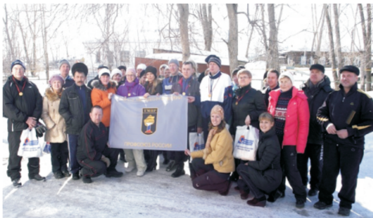
Мы - команда!

Уверен, что эти незабываемые ощущения разделили и мои коллеги и пожелают испытать их ещё не раз. Возьмут с собой своих