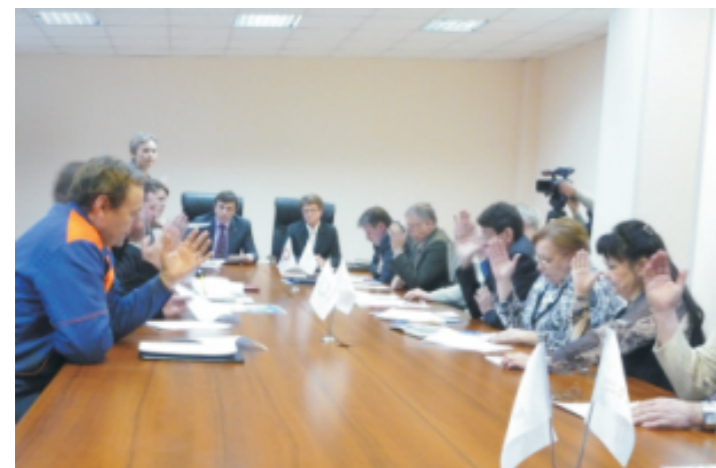
Голосование членов профкома за заключение Соглашения