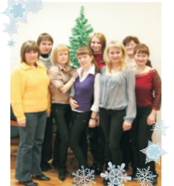
Девчата из молодежного актива ОТК известны участием в различных

Коллектив бригады поздравляет всех с наступающим Новым Годом и желает процветания родному предприятию, а его работникам и их семьям новогоднего настроения, здоровья, радости, материального благополучия, достойной зарплаты, чтобы все задуманное в новогоднюю ночь исполнилось.