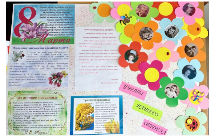
Плакат коллектива финансового отдела

Номинация «С любовью к женщинам» - коллектив мужчин ЭСПЦ