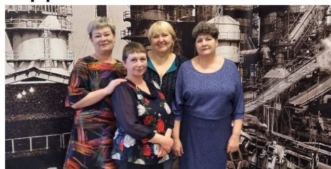
Операторы станков с ПУ (мех.цех)

В наступающий Новый год пусть дни наполняются радостью и улыбками. Примите пожелания крепкого здоровья, благополучия и исполнения всех планов и мечт. Мира, добра и счастья в каждом мгновении жизни! Пусть новый год станет для вас началом новых возможностей!