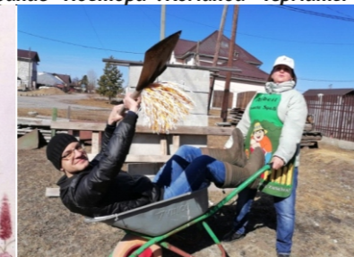
Задание «Повтори». Команда «Креативно-интеллектуальный потенциал».