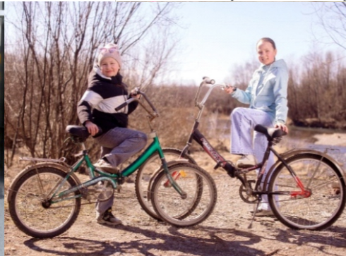
«Все гениальное просто»