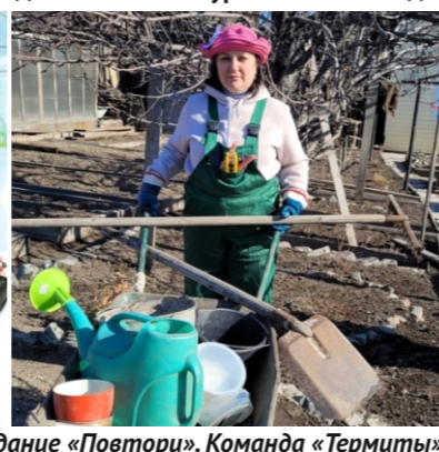
Задание «Повтори». Команда «Термиты».