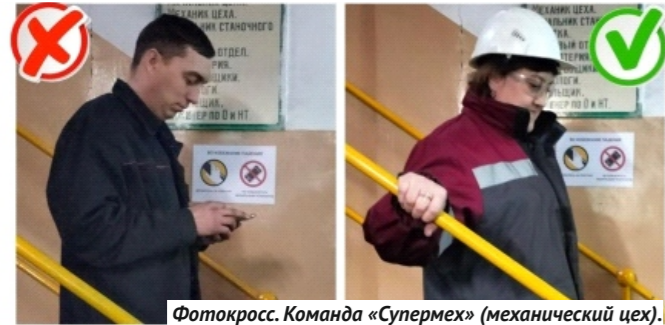
Фотокросс. Команда «Супермех» (механический цех).