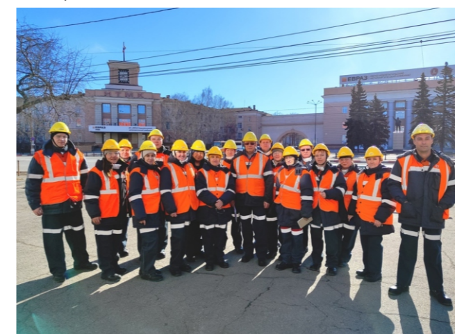
Старшие уполномоченные по охране труда на АО «ЕВРАЗ НТМК».

В течение апреля проходит смотр-конкурс на звание «Лучшего уполномоченного по охране труда ППО». В соответствии с Положением о конкурсе профактивисты подготовили пояснительные записки о своей работе с предложением дополнительных материалов, в том числе необходимых фотографий. Итоги будут подведены к 28 апреля - Всемирному дню охраны труда, награждение состоится на семинаре уполномоченных по ОТ.