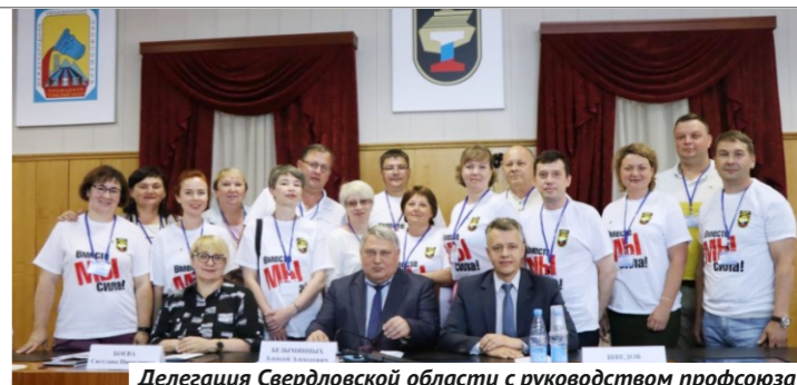
Делегация Свердловской области с руководством профсоюза