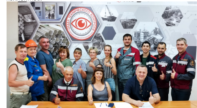
Профактив крупносортного цеха.

Надо отметить, что профактиву подразделений есть чем гордиться, особенно когда есть серьезная поддержка всего коллектива.