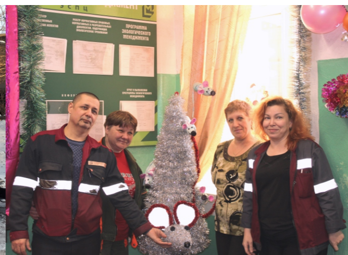
Электросталеплавильный цех. Продолжение на стр. 3