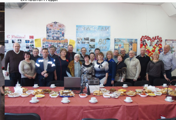
Цех контрольно-измерительных приборов и автоматики.

Для наших дорогих посетителей мы всегда украшаем залы столовых и обязательно самостоятельно рисуем плакат с символом года.