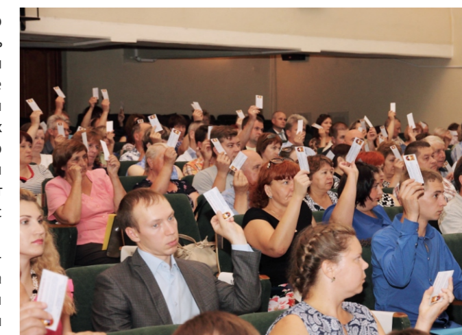
Голосование делегатов профсоюзной конференции в 2016г. (Фото из архива).

В связи с выходом Приказа по предприятию №346 и нового Регламента работы по профилактике распространения коронавирусной инфекции принято решение о проведении профсоюзных собраний очно с соблюдением норм, предусмот-