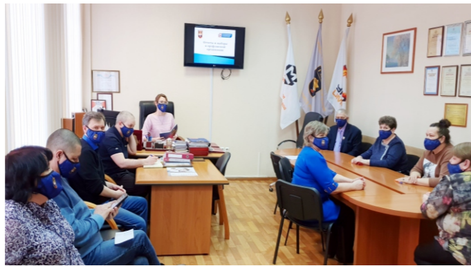
Семинар «Отчетно-выборные собрания в профгруппах».

Следующим этапом обучения будут семинары для профлидеров по проведению цеховых собраний и конференций.