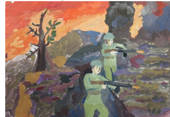
Гребнев Савелий, 10 лет