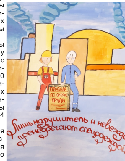
Рисунок, представленный на конкурс «Жизнь и здоровье главное всего». Автор Даниил Старыгин.

пасных условий труда, проведения медосмотров, обеспечения спецодеждой и СИЗ, организация обучающих семинаров и конкурсов по вопросам охраны труда, привлечение максимального количества работников к участию в данных мероприятиях.