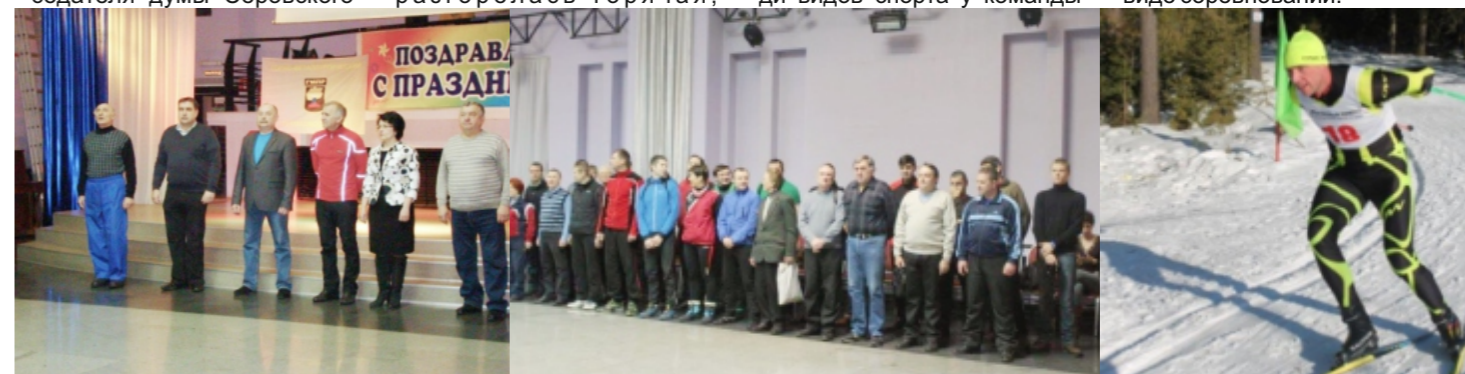
Представители организаторов, города и предприятий приветствуют спортсменов

Порадовала своим результатом команда нашего завода по дартсу, созданная из работников литейного цеха. Ребята в свободное от работы время продолжительно и упорно тренировались, нарабатывали навыки метания. И это, конечно, сказалось на результате - практически все дротики с легкостью попадали в десятку, несмотря на то, что спортсмены всего второй раз принимают участие в этом виде соревнований.