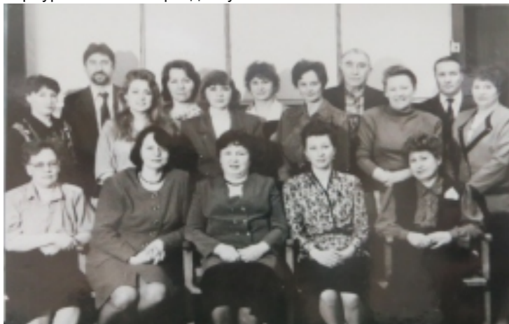
Работники ОТК (1996г.)

Хочется пожелать, чтобы торжество прошло успешно, юбиляры получили положительные эмоции и готовились к следующей праздничной дате.