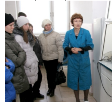
Экскурсия для учащихся

Бегут года, проходят вёрсты, И в день рождения грустим, Что с возрастом нам жить непросто, Не так как раньше – молодым. И как же быть?! Поникнуть, сдаться И думать, что конец один, И по-пустому волноваться, Переживать из-за морщин?! Да, нет же! Надо жить иначе! Совсем иначе надо жить! И каждый день считать удачей И каждый миг его ловить!