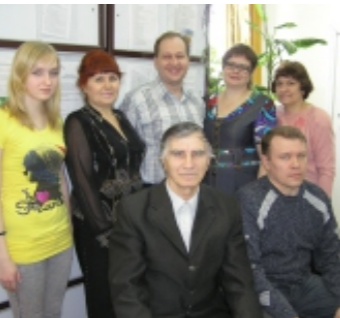
домах царят благополучие, любовь и процветание.

Пусть всегда с вами будут родные и друзья, а в ваших