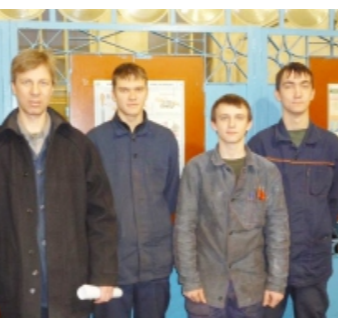
следующий Новый год встретить тем же составом!

Желаем всем нам в наступающем году поменьше огорчать друг друга и