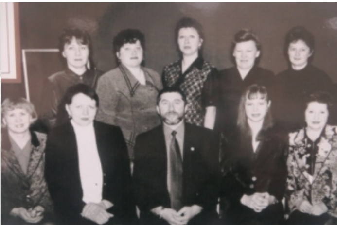
Работники ОТК (2001г.)