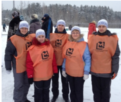
Команда профорганизации ОАО «Металлургический завод им. А.К. Серова».

Вот так интересно и необычно профсоюзные организации Серовского городского округа отметили День образования профсоюзного движения в Свердловской области.